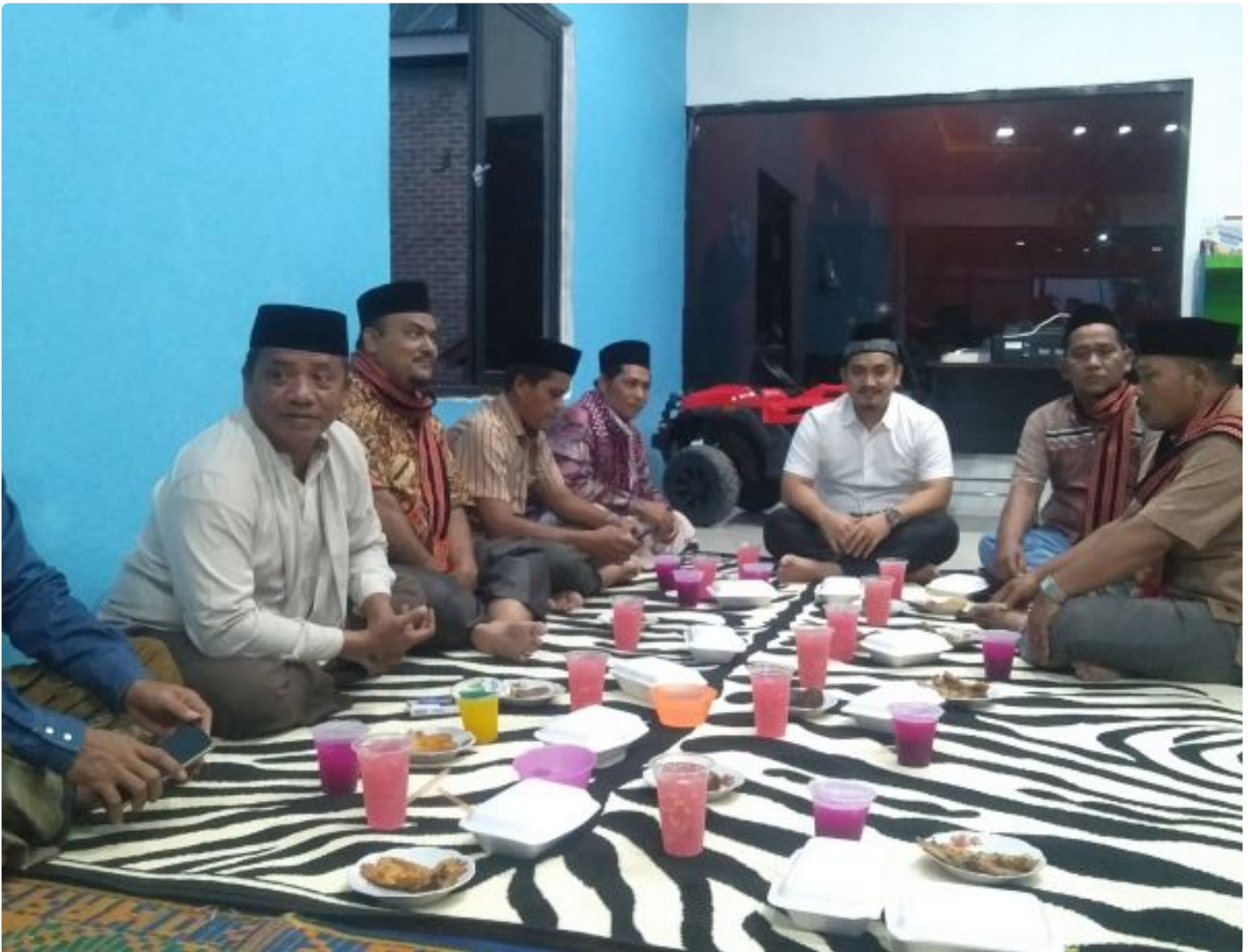
Poto Bersama Saat Berbuka Puasa

Aceh Tenggara - Silaturahmi tidak hanya memperpanjang umur dan memperbanyak rezeki. Silaturahmi juga diharapkan makin memantapkan konsolidasi, seperti organisasi gayo musara sehingga makin solid diantara pengurus. Dengan demikian, kerja-kerja organisasi gayo musara juga makin baik